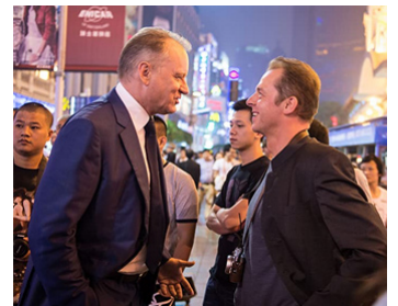
2014 HECTOR ET LA RECHERCHE DU BONHEUR (Hector...) de Peter Chelsom avec Simon Pegg