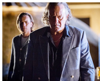
2016 UN TRAITRE IDÉAL (Our Kind of Traitor) de Susanna White avec Ewan McGregor