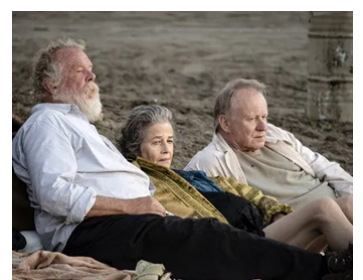
2020 LAST WORDS de Jonathan Nossiter avec Nick Nolte, Charlotte Rampling