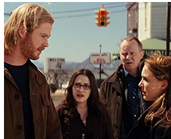
2011 THOR (Thor) de Kenneth Branagh avec Chris Hemsworth, Kat Dennings, Natalie Portman