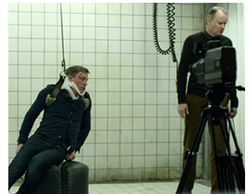
2011 MILLÉNIUM (The Girl with the Dragon Tattoo) de David Fincher avec Daniel Craig