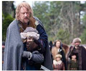
2007 ARN, CHEVALIER DU TEMPLE (Arn, tempelriddaren) de Peter Flinth