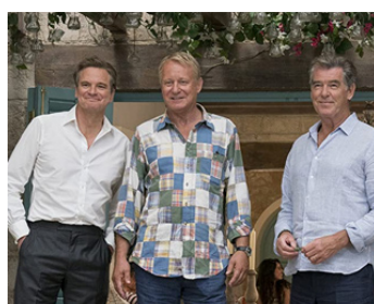
2018 MAMMA MIA ! HERE WE GO AGAIN d'Ol Parker avec Colin Firth, Pierce Brosnan