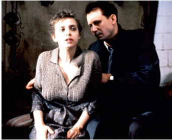
1990 BONSOIR, M. WALLEMBERG (God afton, Herr Wallenberg) de Kjell Grede avec Katharine Thalbach