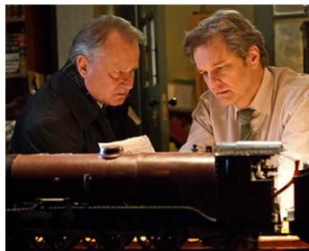
2013 LES VOIES DU DESTIN (The Railway Man) de Jonathan Teplitzky avec Colin Firth