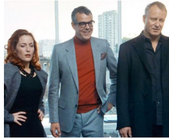
2009 BOOGIE WOOGIE de Duncan Ward avec Gillian Anderson, Danny Huston