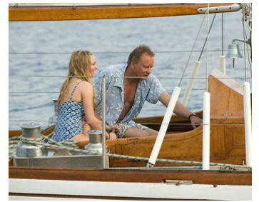
2008 MAMMA MIA ! de Phyllida Lloyd avec Amanda Seyfried