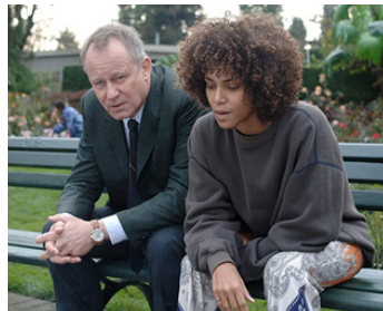
2010 FRANKIE ET ALICE (Frankie & Alice) de Geoffrey Sax avec Halle Berry