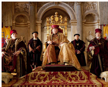
2013 ROMÉO ET JULIETTE (Romeo and Juliet) de Carlo Carlei avec Tomas Arana, Clive Riche